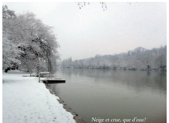
Neige et crue, que d'eau!