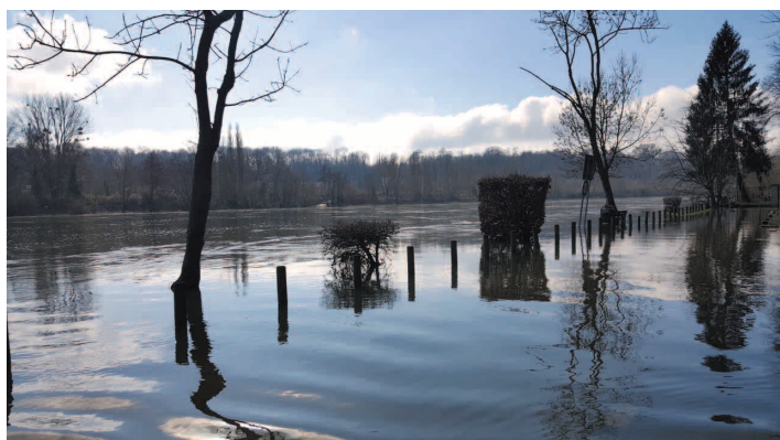
Chemin des Praillons

Bien sûr les dégâts sont peu importants comparés à d'autres communes en aval, mais plusieurs habitants ont vécu des moments d'angoisse :