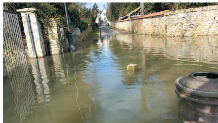
Rue Paul Gillon

La déchetterie du SMITOM est accessible aux sinistrés sans décompte de leurs droits d'accès : il suffit de signer à la Mairie une convention donnant droit à un bon de dépôt.