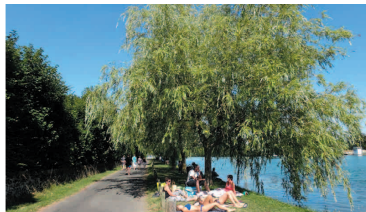
Chemin des Prailons, août 2015

Les berges sont notre fierté et attirent les promeneurs depuis plus d'un siècle. Fragiles, elles ont été consolidées à plusieurs reprises mais avec la crue de juin 2016 tout est à refaire !