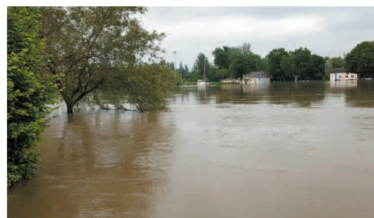
Chemin des Prailons, juin 2016