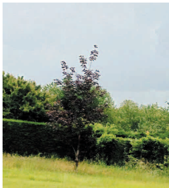
27 ans après, il croît encore !