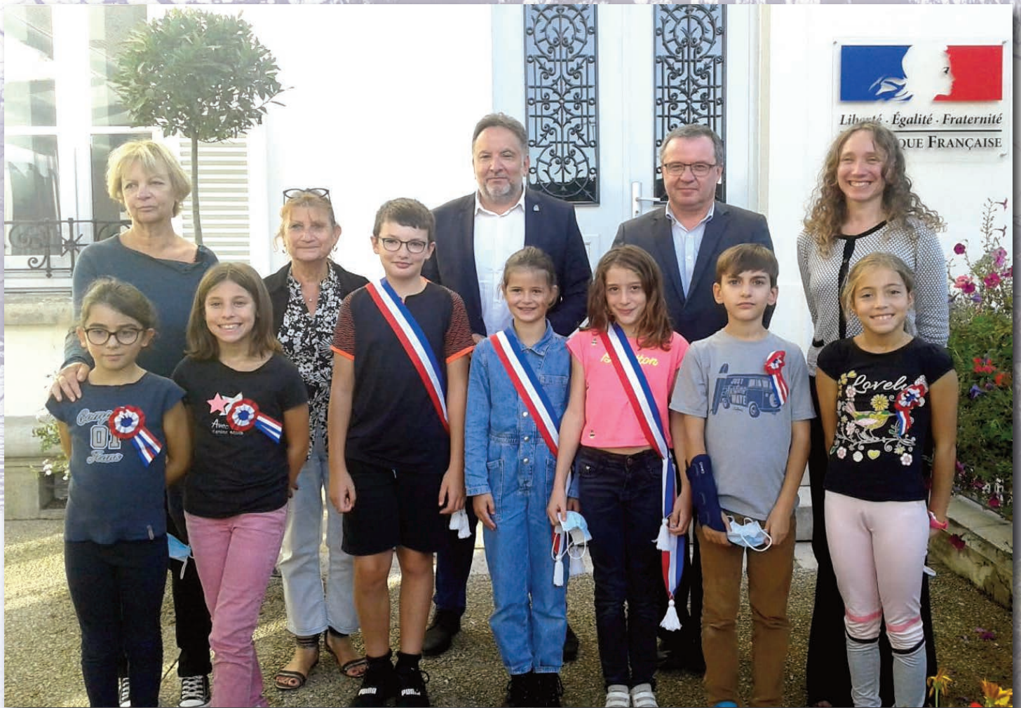
Conseil Municipal des enfants 2021-2022

www.boissettes.fr / Courriel : mairie@boissettes.fr