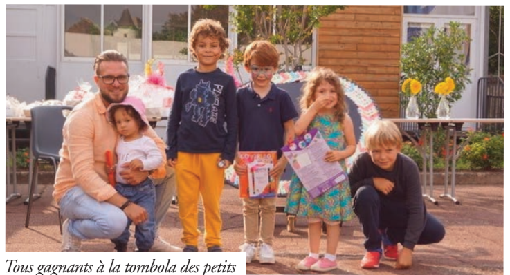
Tous gagnants à la tombola des petits

C'est dans la bonne humeur que petits et grands, 90 personnes au total dont 20 nouveaux habitants, ont renoué dimanche 19 septembre avec le traditionnel repas champêtre, auquel nous avons dû renoncer l'an dernier pour cause de crise sanitaire.